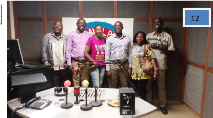
Photo 7 & 8 : ST et Photo de famille avec le Directeur Général- IFO